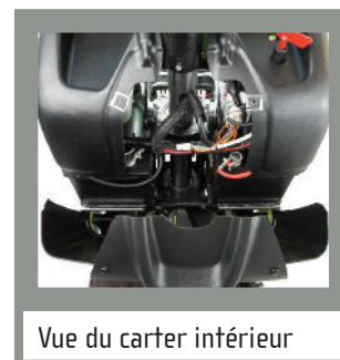
Vue du carter intérieur

Disponible avec des batteries de semi-traction version PLUS (Capacité 45Ah) et batterie GEL (Capacité 41Ah)